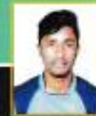
D. MIKRAM I BBA ATHLETICS