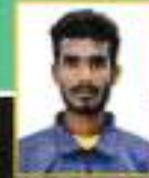
K. PAMSH II B. Com (CA) Kho-kho