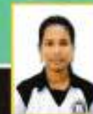
G. SONYA III BCA Kho-Kho